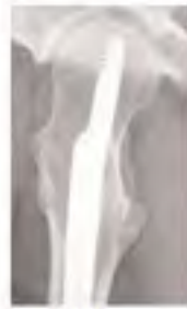
Ameliyat Sonrası 12 ay Lateral