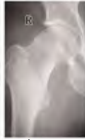
Ameliyat Öncesi AP