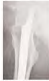
Ameliyat Sonrası Lateral