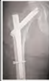
Ameliyat Sonrası AP