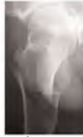
Ameliyat Öncesi Lateral