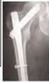
Ameliyat Sonrası 12 ay AP